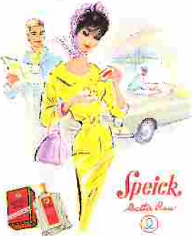
Nostalgische Postkarten erinnern an früher