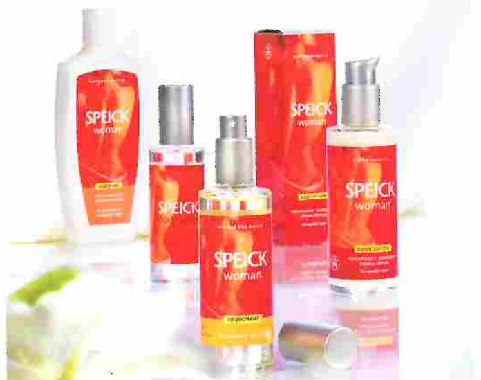
Teil des heutigen Speick-Sortiments: die „Woman“-Serie mit Body Spray und Lotion